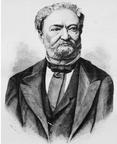
Erkel Ferenc zeneszerző

Erre a napra számos kulturális rendezvényt szerveznek hazánkban, s a határokon túl is a magyarságnak.