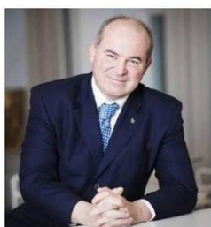
Szalay-Bobrovniczky Vince civil és társadalmi ügyekért felelős helyettes államtitkár